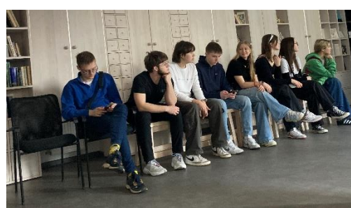
Ekskursija uz Imanta Ziedoņa fonda "Viegli" izlaušanās spēli "Blēņas un pasakas".