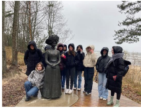
Pārgājiens pa Raiņa un Aspazijas dzīves un mīlestības vietām Jūrmalā.