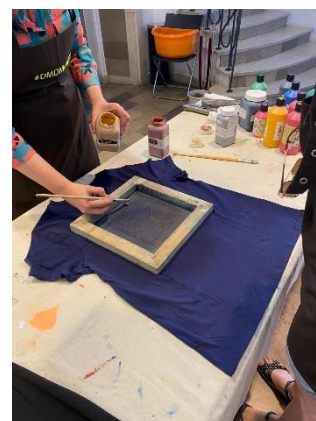
Ekskursija uz Dekoratīvās mākslas un dizaina muzeju.