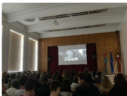
Filma "Marijas klusums" skatīšanās.

RTU Olaines Tehnoloģiju koledžas pedagogi un audzēkņi ļoti novērtē sniegto iespēju iepazīt Latvijas kultūru un tās notikumus, gūstot jaunas pieredzes un piedzīvojot radošu mācību procesu.